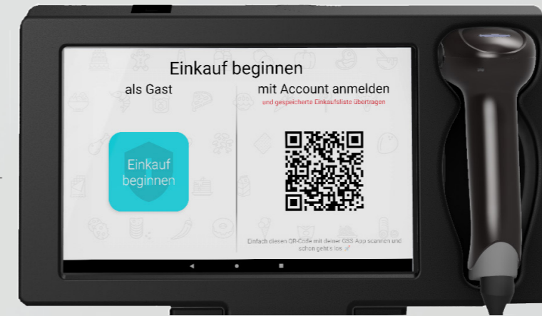
Wasser- und stoßfestes 10" Touch-Display mit inte- griertem Scannersystem