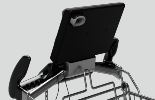
Rückseite der Aufsteckhalterung