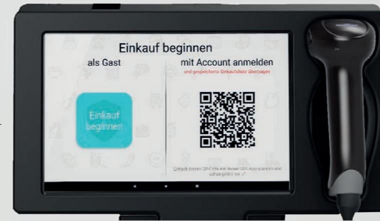
Wasser- und stoßfestes 10" Touch-Display mit integriertem Scannersystem