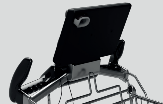
Rückseite der Aufsteckhalterung