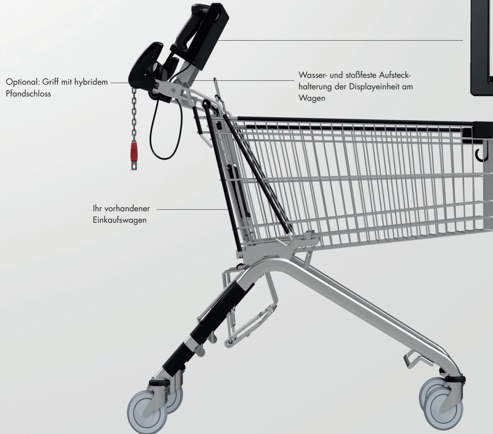
Optional: Griff mit hybridem Pfandschloss